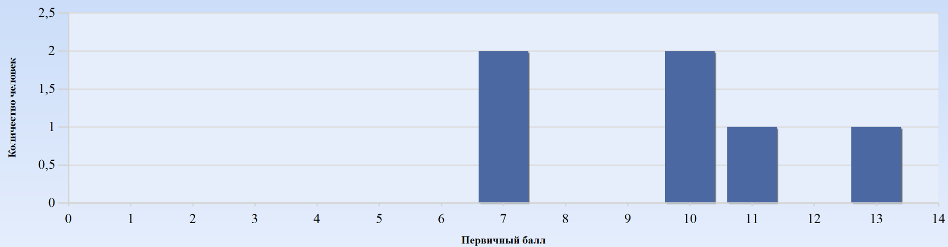
Гистограмма первичных баллов по образовательной организации ЕГЭ